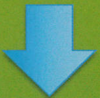
キャスパー・アプローチ アフター

授業中いつも机に突っ伏していた男子。書見台を使って先生に声をかけられても、ほんの少しの時間しか黒板を見る事が出来ません。しかし、キャスパーでは授業時間中ずっと黒板を見ることが出来ますし、それまで苦手だった細かな作業も上手に出来るようになり、斜視があったのも徐々に変化してきてくれました。