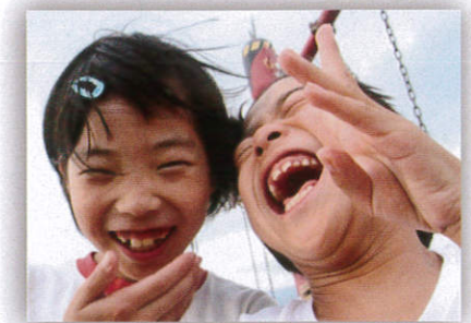
笑顔の物語がここから始まる

姿勢を安定することは日常生活において重要な要素です。しかし、頭や身体が倒れたり、手が使いにくかったり、お尻がずれたりされている方がいます。「キャスパー・アプローチ」には、そんな現状を大きく変化させる可能性があります。キャスパー・アプローチは日常生活の場から生まれた「全く新しい考え方の姿勢安定技術」です。日常生活をより豊かにするために数千例の具体的な症例を積み重ねた技術ですから、実践的で結果の出る手段です。また、成功経験のサイクルを作り、ワクワクする日常生活を支援するために考案した姿勢安定技術でもあります。